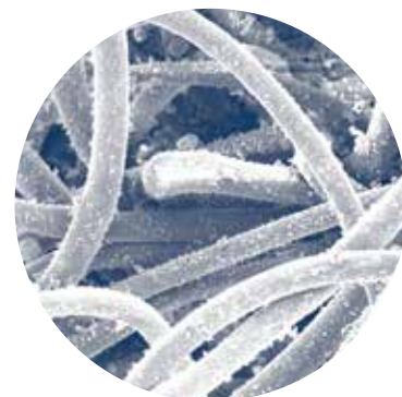
Bolsa de Polyester–Lado Limpio del Aire(300x)