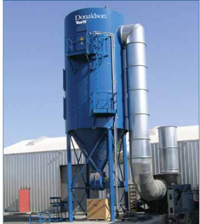
Las bolsas Dura Life en este colector de polvos Donaldson Torit RF proporciona vida más larga y menores emisiones en esta planta de procesamiento de frijol de soya del Medio Oeste

¿Vida de filtro más larga y menores emisiones? Eso es enfrentar al polvo de proteína con fuerza.